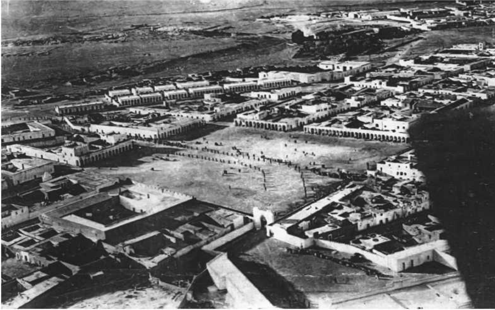
Vista aérea de Campo de Boghar, fotografía obtenida de un periódico de la época