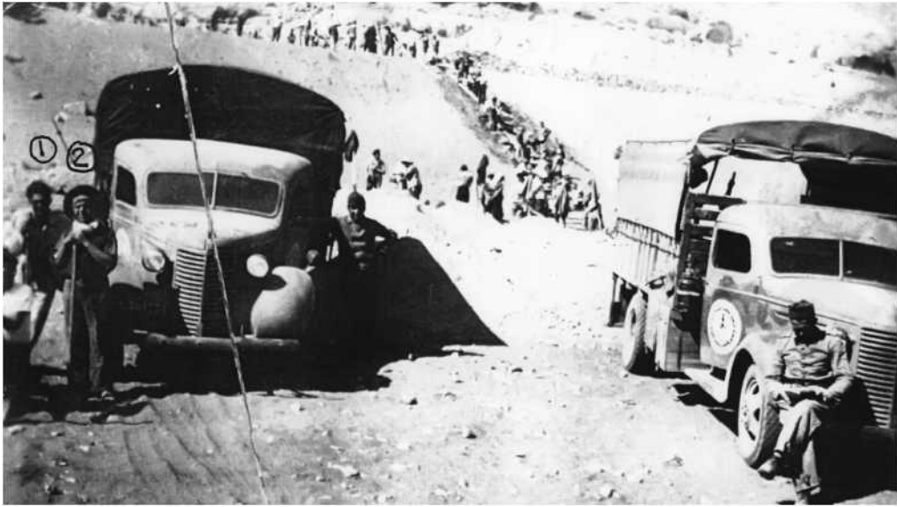
1- Pedro Julián 2- Vicente Verdeguer