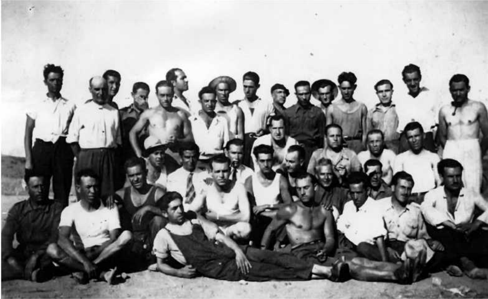
Grupo de trabajadores n° 10, tras su liberación