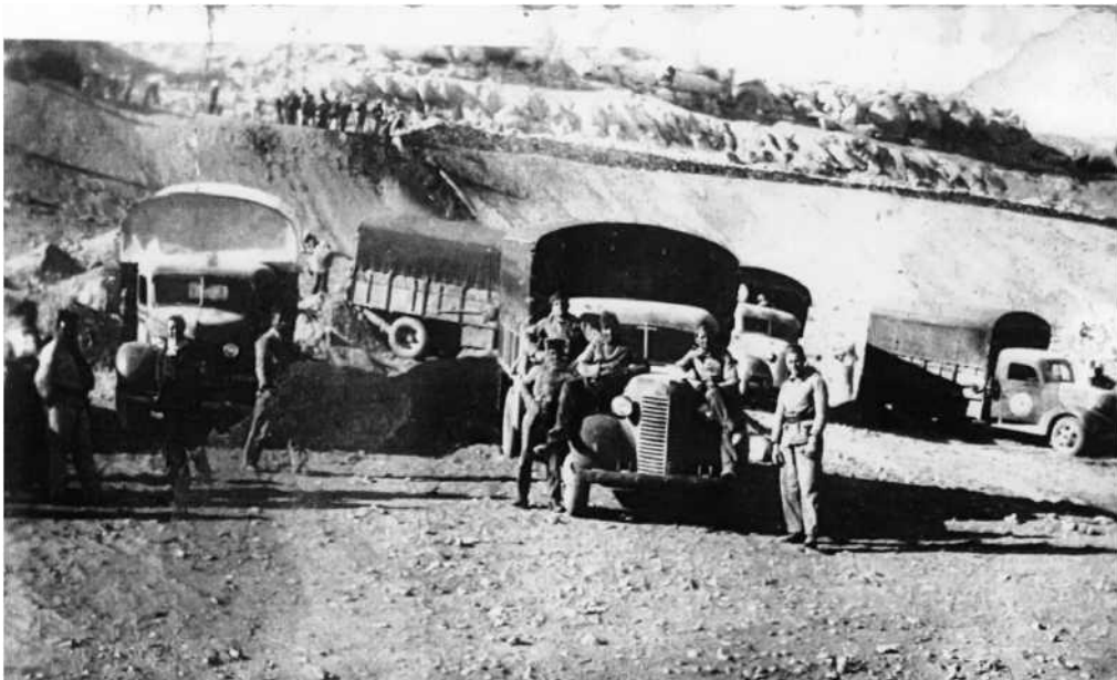
Trabajos del Transahariano