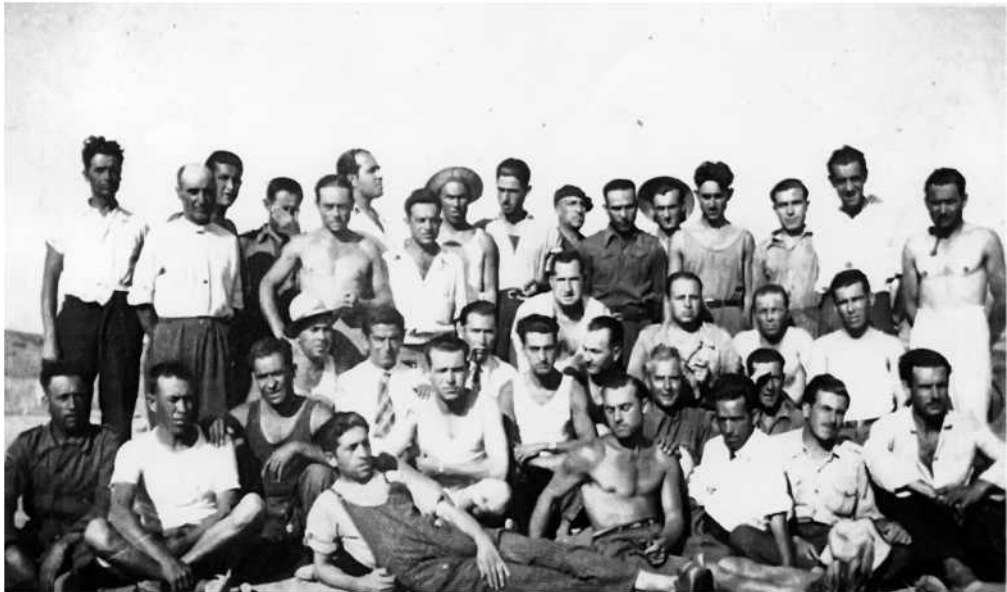
Grupo de trabajadores extranjeros n° 10