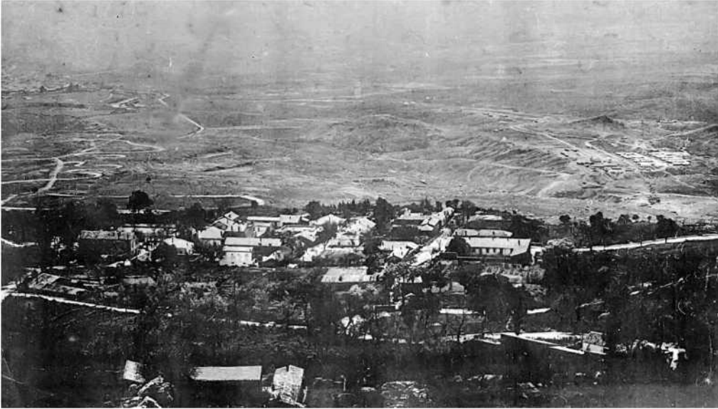
Vista aérea del campo de Boghar